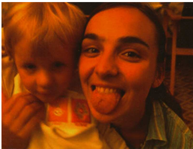
Vorbild wirkt besser als Worte!

Mit „ Starke Eltern - starke Kinder “ ® wollen wir erwerbslose Menschen mit Kindern miteinander ins Gespräch bringen. Im Kontakt mit anderen Eltern bekommen Sie neue Ideen und mehr Sicherheit im Umgang mit Ihren Kindern. Eine erfahrene Referentin unterstützt sie mit Übungen, Hintergrundwissen und pädagogischen Tipps.